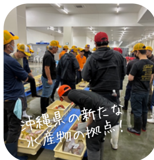
※イマイユ市場内観（イメージ）