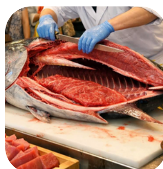
※マグロの解体ショー （イメージ）