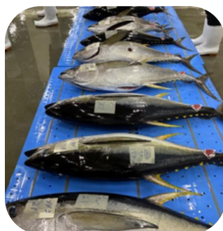
※競りに並ぶマグロ（イメージ）